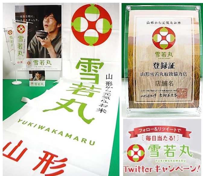
(左)販促資材セット(例)