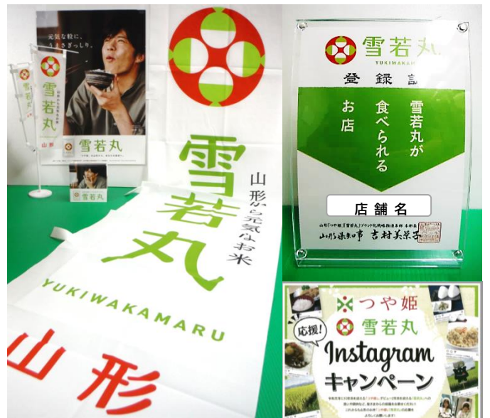
(左)販促資材セット(例)