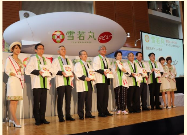
「雪若丸」、出航します！

「雪若丸」は、しっかりした粒感と適度な粘りが両立した“新食感”が特長のおコメです。ぜひ、家族みんなでお腹いっぱい召し上がってください！