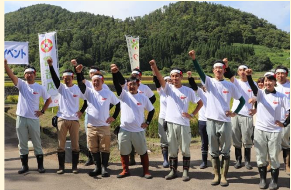
チーム雪若丸の稲刈り宣言で刈取り開始！

9月13日(木)、爽やかな秋晴れのなか、デビュー9年目を迎える「つや姫」と、今年本格デビューする「雪若丸」の稲刈りイベントを山形県農業総合研究センター(山形市)で行いました。イベントには、知事やつや姫レディ、チーム雪若丸、モンテディオ山形の選手などが参加。知事は「雪若丸」が「つや姫」に続くブランド米として愛されるおコメになるよう、皆さんでPRしていきましょう」と参加者に呼びかけました。