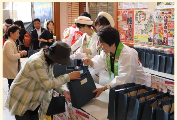
知事が消費者に「雪若丸」を手渡しました