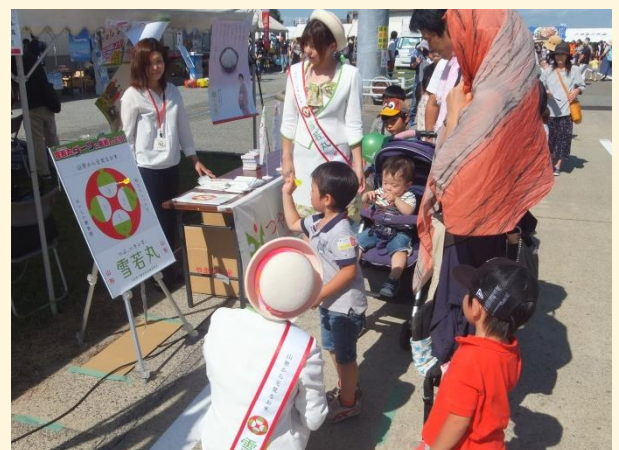
よく狙いを定めて…、「雪若丸」をゲット！

ダーツの的となる「雪若丸」ロゴマークのテーマは、「日本の元気を食卓から」。食卓に集まった家族とその笑顔を表現しています。「雪若丸」をゲットした皆さんが、家族みんなで「雪若丸」を食べる様子が目に浮かぶようでした。