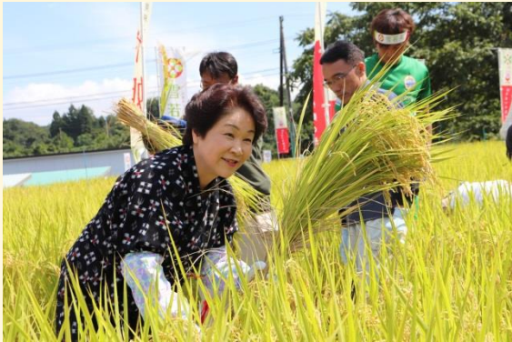
豊かに実った「つや姫」を刈取る吉村知事